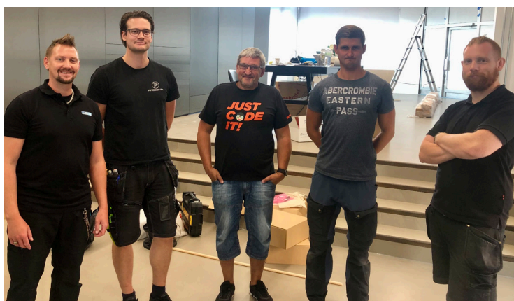
Installation av Digital Equipment för Polestars space i Oslo.

I nästa rapport berättar jag mer om vårt gemensamma uppdrag och vår dröm. Hur våra gemensamma "matchtröjor", dvs vår visuella identitet, kommer att se ut. Vårt TopFamily-lag tar position på en mängd olika spelplaner, men vår unisona laganda är att "vi älskar att göra smart teknik nyttig – för dig och för världen".