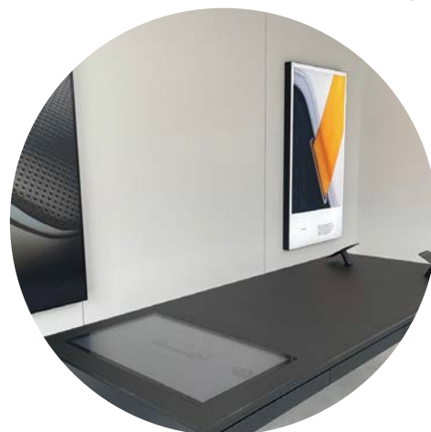
Bild från TopRights installation av Polestars showroom i Rom

Beslutet att växa och satsa inom TopSolutions och TopEnvironment, där TopRight har stor framgång mot kund och inte minst en bra lönsamhet, gör att koncernen efter omställningen beräknas stå stadigt. Tillväxt i prioriterade områden ska fortfarande ske både organiskt och genom strategiska förvärv.